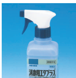
ガン式ポンプ装着