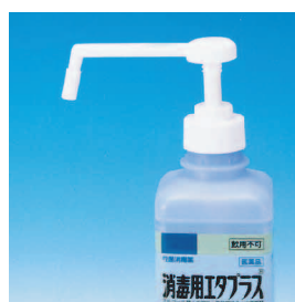
手押し式スプレーポンプ装着