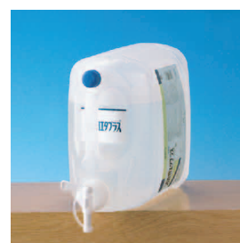
スクリュウコック装着